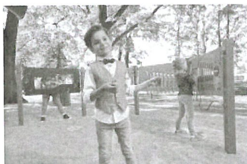
NIVEA PLAC ZABAW0639.jpg ~588 KB