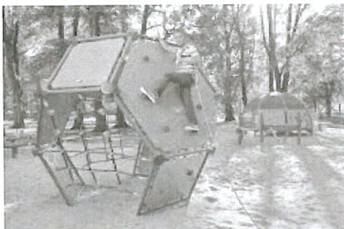
NIVEA PLAC ZABAW0604 1.jpg ~695 KB