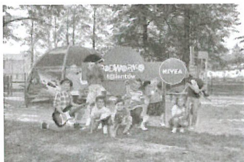
NIVEA PLAC ZABAW1346.jpg ~762 KB