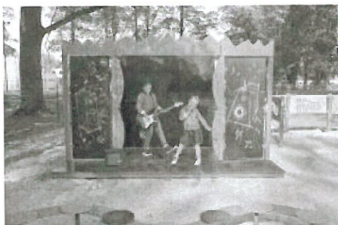
NIVEA PLAC ZABAW0330.jpg ~555 KB