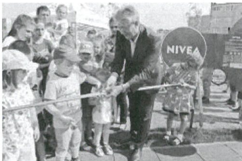
Trzemieszno--_Zdjecia2 z otwarcia_NIVEA_P_2015 (4).jpg ~704 KB