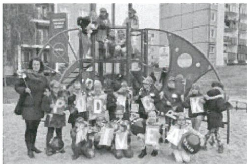
Srem--_Zdjecia z otwarcia_NIVEA_P_2016 (8).jpg ~136 KB