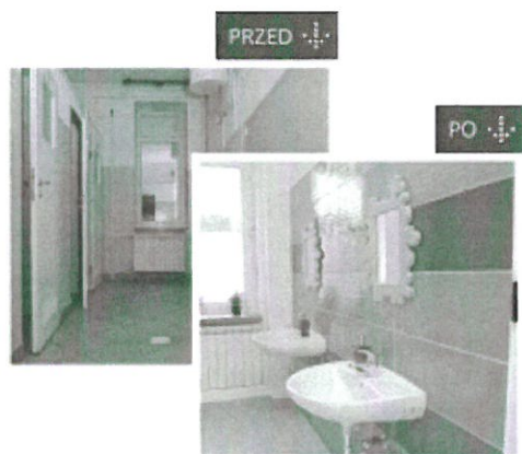
przed_po_1.png ~390 KB