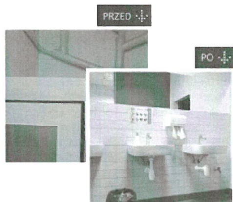
Świętochłowice-sp-przed_po_2.png ~341 KB