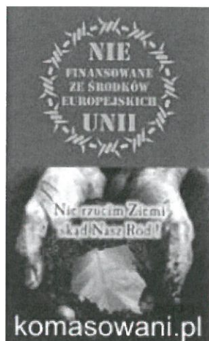
komasowani150na247.jpg ~53 KB