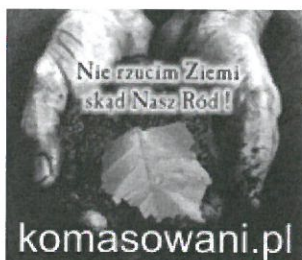
komasowani150na130.jpg ~34 KB

Przypominamy, na podstawie art. 8. wspomnianej ustawy z dnia 11 lipca 2014 r., że petycja (odwzorowanie cyfrowe - skan), data jej złożenia jak i informacje dotyczące przebiegu postępowania oraz odpowiedź (w ustawowym terminie) powinny zostać niezwłocznie zamieszczone na stronie internetowej JST.